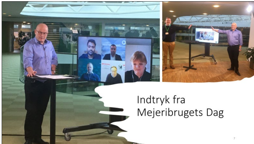
Indtryk fra Mejeribruggets Dag